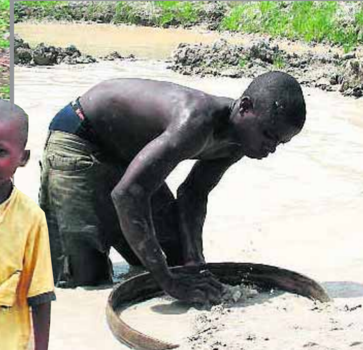
■ Vroeger de hele dag aan het werk; nu krijgen de kinderen dankzij de Sunday Foundation onderdak en onderwijs.