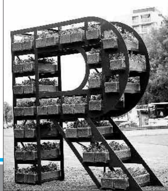
• Nabij het stadion van Excelsior staat een van de bloemen-R's.